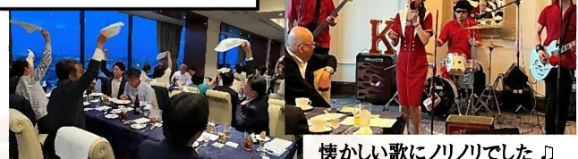
懐かしい歌にノリノリでした♪