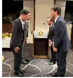
川津会長→広上次期会長 古本幹事→小川次期幹事