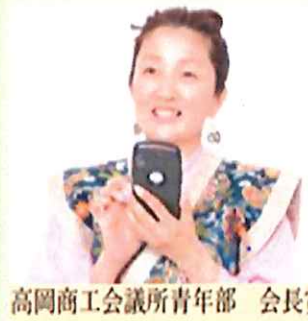
高岡商工会議所青年部 会長

・昨年、例会時にもPRさせていただきました、妻が所属している高岡商工会議所青年部の～令和版高岡万葉集～が完成しました！ 青年部のホームページに掲載されていますので、ぜひご覧下さい！！