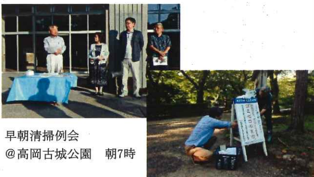
早朝清掃例会 @高岡古城公園 朝7時