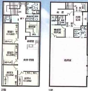
小規模グループケア棟 (ひまわり)