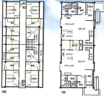
小規模グループケア棟 (かがやき、コスモス)