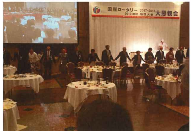
大懇親会 (ホテルアローレ) 「手に手つないで」