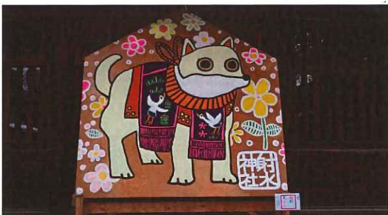
↑大絵馬：七彩犬力士